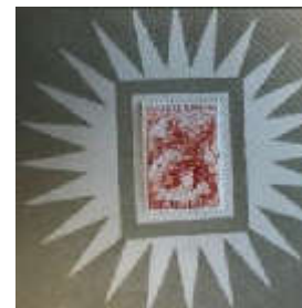
Enkele pagina's uit het boekje